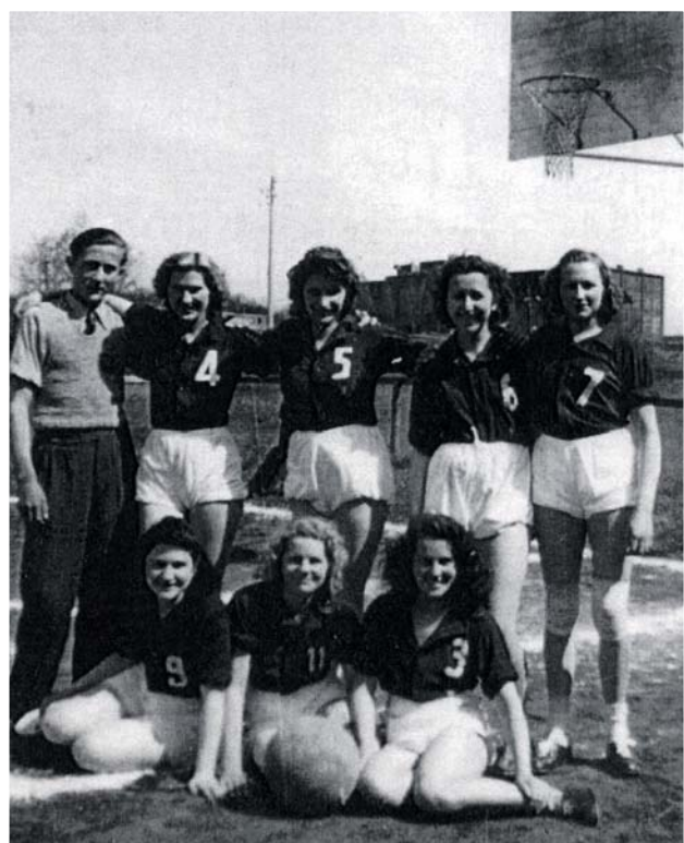
1944 : première équipe féminine (ici à l'occasion d'une rencontre avec Bataville)

C'est donc sous différentes appellations, que le basket sarrebourgeois a traversé les années. Des générations de joueurs, d'entraîneurs et de bénévoles ont par leur esprit sportif, leur volonté et leur engagement permis au basket club de belles distinctions sportives (palmarès régionaux et nationaux) et de très beaux moments de convivialité. Le New Basket Club de Sarrebourg en fêtant ce bel anniversaire tient tout particulièrement à rendre hommage à tous ceux et celles qui ont participé à la belle aventure du basket à Sarrebourg, et à remercier tous les sarrebourgeois pour leur soutien et leurs encouragements tout au long de ces années.